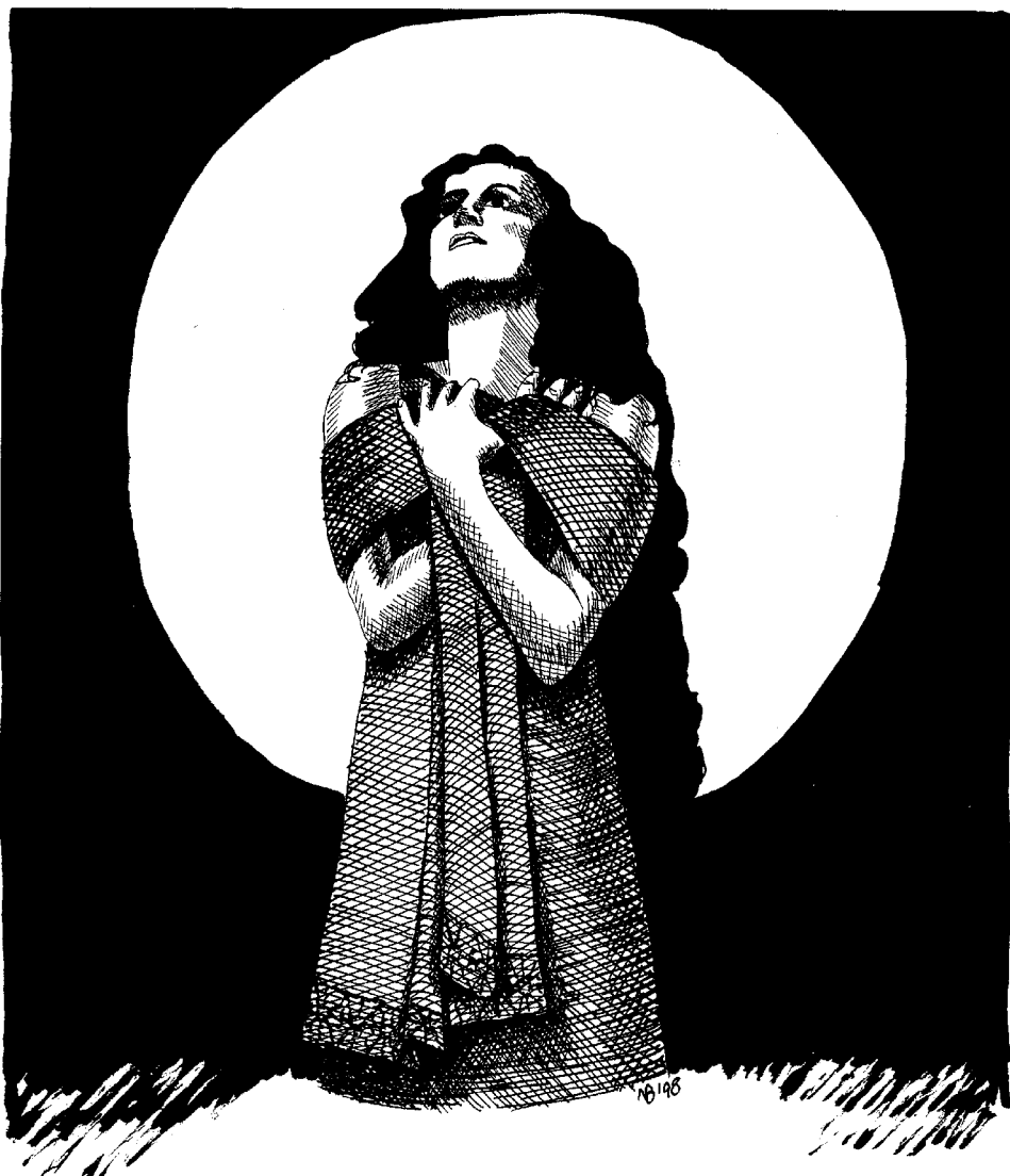
„Haiku, eine „Inafens“ von Nina Baur

Nahe der Stadt Hrazz'dursa wurde die Entstehung von seltsamem Gebilden aus Eis durch Zaubermacht beobachtet. Manrastor scheint nach der Aussendung seiner Missionare wieder im Frost erstarrt. Oder regt sich lebendiges oder totes im Land des ewigen Eises?